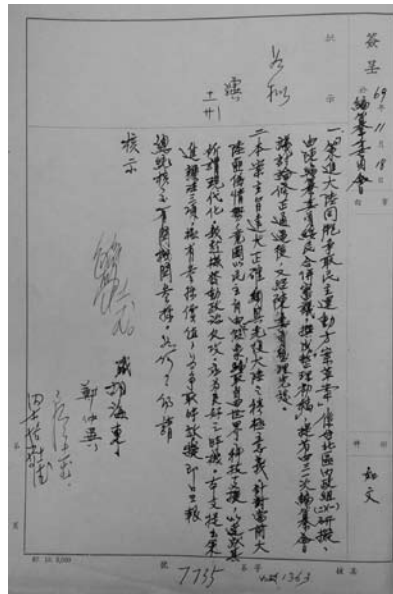
光復大陸設計委員會編纂委員會為研擬完竣策進大陸同胞爭取民主運動方案簽請呈報總統核交機關參採

包括發展僑胞教育文化，輔導畢業僑生就業問題，輔導華僑經濟事業，擴大爭取僑資外資，華僑回國投資法令檢討改進，鼓勵華僑回國學習國語，海外僑區推行中華文化復興運動，運用僑社力量促進外交關係，加強僑胞組織與維護，加強僑胞國民外交工作，加強無邦交國家之僑胞聯繫配合務實外交，加強便僑措施、僑胞心理建設，大陸光復後僑務政策、加強僑務工作等案。