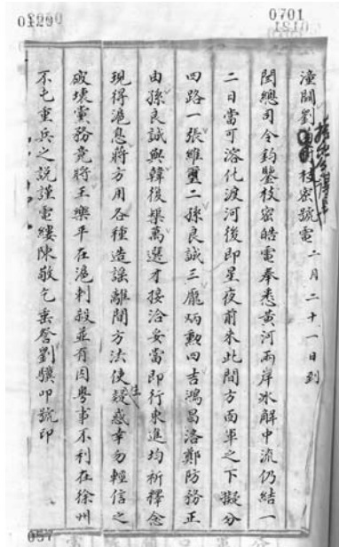
劉案大事國黨論一存錄電要 驥致閻錫山電

(一) 各方往來電文原案及錄存：包括 1917 年，1919 至 1926 年，1929 至 1937 年電文原件，以及由原件翻譯抄錄的電文錄存。此批檔案，