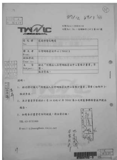
臺灣網路資訊中心（TWNIC）檢送財團法人臺灣網路資訊中心籌備計畫書草案

包括交通部函請電信總局對九十年中日技術合作計畫方案作業要點及中日技術合作計畫實施計畫研提意見、交通部函送有關駐美代表處對美國在臺協會說明美方關切國際海纜電路出租及電信市場自由化等事相關資料、電信總局函復有關美國參議院外交委員會主席赫姆斯等四位參議員聯名關切電信市場開放相關規定、電信總局函送為因應部長率團出席 APEC 第四屆電信部長會議所研